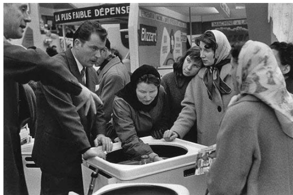
Salon des Arts Ménagers 1956

L'institution de la Sécurité sociale permet de se prémunir contre les aléas qui affectent la vie professionnelle. Parallèlement, la France connaît une situation de quasi-plein-emploi pendant laquelle le taux de chômage est contenu à un niveau compris entre 2% et 3% (contre environ 9,5% en 2005).