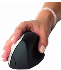
Souris pour droitier