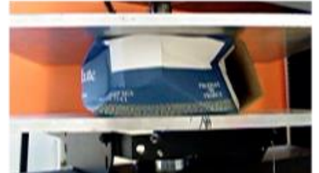
Exemple de compression d'une boîte en carton

Lorsque vous avez fait les tests de compression du carton, vous avez observé différentes déformations possibles :