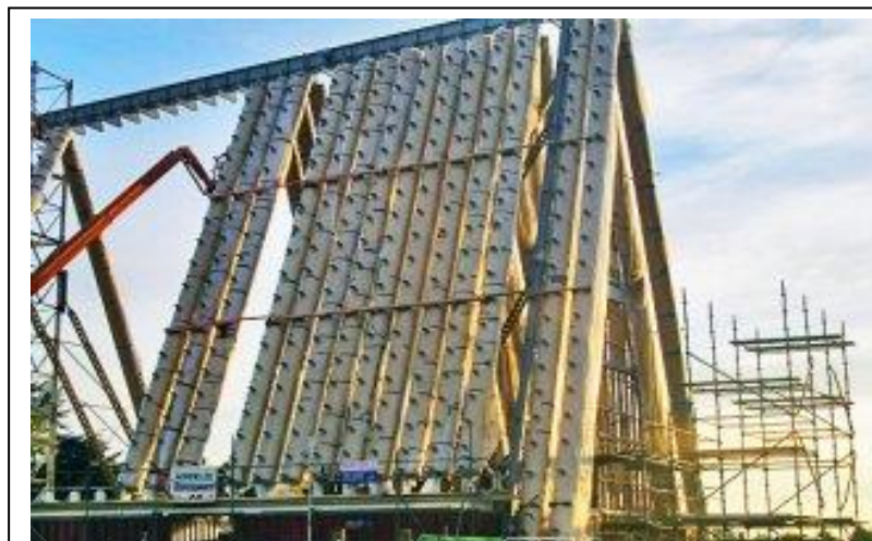
Christchurch (NZ) : une église reconstruite en carton.

Selon vous si le carton, est assez solide pour fabriquer un tabouret, peut-on l'utiliser pour en faire un meuble ?