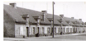
Habitat du 19ème siècle Révolution industrielle