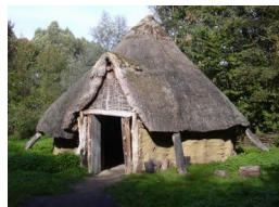
Habitat de l'âge de bronze