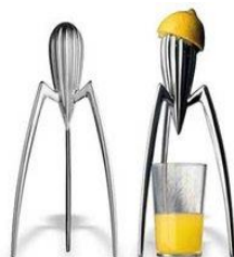
Presse agrumes de philippe Strack

Le design de produit crée l'aspect visuel extérieur des produits (sa forme, ses couleurs, son ergonomie, sa taille, etc) tout en respectant les fonctions techniques et les contraintes économiques .