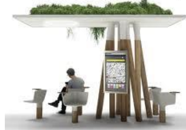
Espace numérique JC Decaux 2012

Le design d'espace consiste à aménager des lieux publics ou privés (commerce, bureau, stand...), ou à créer des scénographies (exposition, évènementiels...). Le designer d'espace joue avec les espaces, la lumière, la couleur, le mobilier, les équipements de façon à créer des lieux opérationnels et confortables, qui reflètent la personnalité du commanditaire et des usagers.