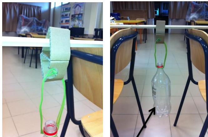
Bidon de 5 litres

Puis compléter la fiche 3-ROT-Test colle E1