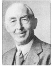
Pierre Boulanger patron de Citroën (1935)

« Faites étudier par vos services une voiture pouvant transporter deux cultivateurs en sabots, cinquante kilos de pommes de terre ou un tonnelet à une vitesse maximum de 60 km/h pour une consommation de trois litres d'essence aux cent kilomètre. En outre, ce véhicule doit pouvoir passer dans les plus mauvais chemins, il doit être suffisamment léger pour être manié sans problèmes par une conductrice débutante. Son confort doit être irréprochable car les paniers d'oeufs transportés à l'arrière doivent arriver intacts. Il devra également être possible de monter à 4 personnes dans la voiture sans quitter son chapeau de la tête. Son prix devra être bien inférieur à celui de notre Traction Avant »